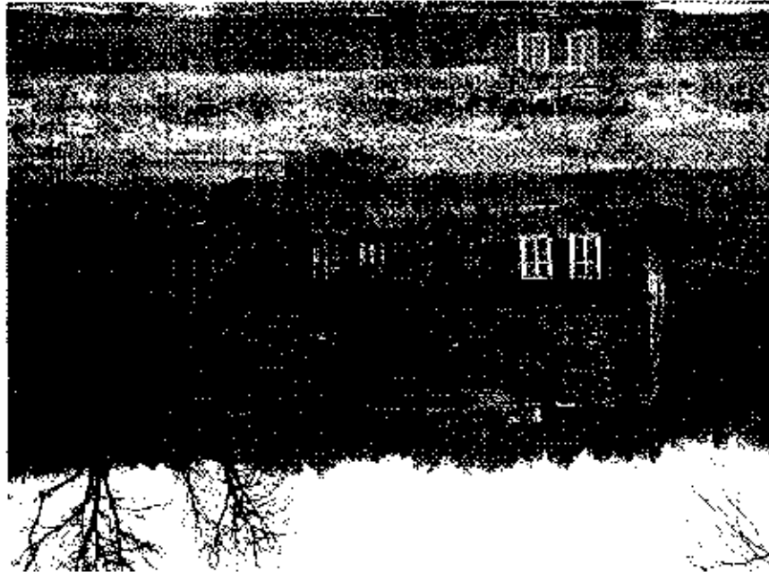
Dom konstrukcji ryglowej położony nad brzegiem jeziora.