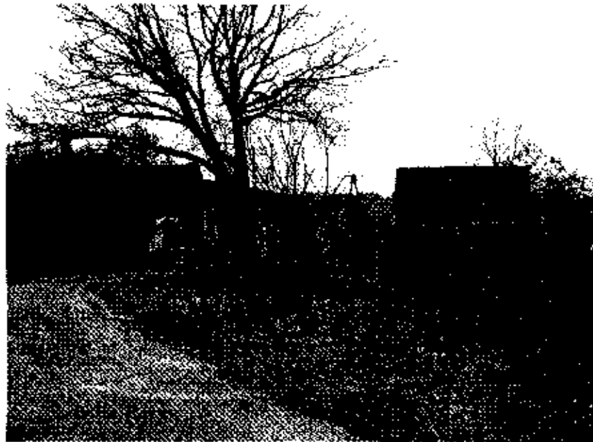
zdjęcie nr 5 *

Droga główna zalicza w centrum wsi malowniczy łuk.