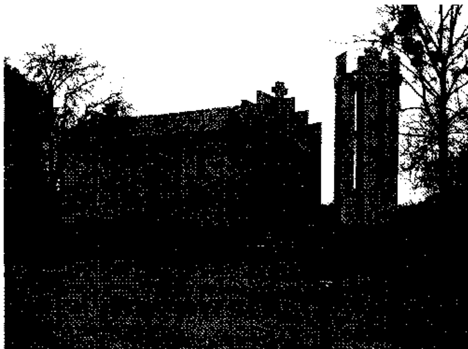
zdjęcie nr 2.1

Kościół filialny p. w. MB Częstochowskiej – bud. w latach 1989 – 1990.