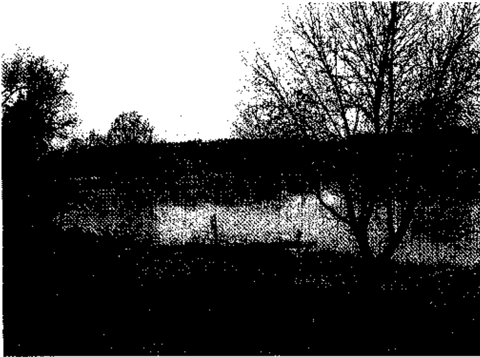
zdjęcie nr. 7*

- Rezerwat przyrody Stary Załom. Znajduje się nad jeziorem Załom, na skraju masywu leśnego Puszczy Drawskiej, na półwyspie Drawieńskiego Parku Narodowego. Na powierzchni 1 ha ochronie podlega zespół łąkowy posadowiony na podłożu kredy jeziornej. Rosną tam osobliwe okazy buka, dębu oraz liczna roślinność rzadko spotykana na obszarach nizinnych – m. in. storczyk, turzyca „ptasie łapki” i rzadkie gatunki mchów.