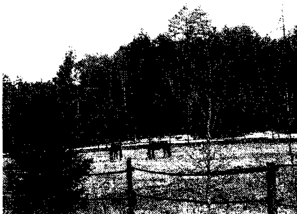
zdjęcie nr 8*

Oprócz walorów przyrodniczych i kulturowych o atrakcyjności turystycznej danego terenu decyduje zagospodarowanie turystyczne, czyli baza noclegowo-gastronomiczna (hotele, pensjonaty, domy wczasowe, pola namiotowe, restauracje, kawiarnie itd.) oraz szlaki turystyczne zarówno lądowe (np. piesze, rowerowe), jak i wodne (np. kajakowe). Turyści chcący wypoczywać na terenie gminy Człopa mają obecnie do dyspozycji 350 miejsc noclegowych, zlokalizowanych na obszarze gminy, z czego większość stanowią pokoje oferowane przez gospodarstwa agroturystyczne. W samym mieście funkcjonuje Ośrodek Wypoczynkowy „SOSENKA” w Człopie dysponujący 33 miejscami noclegowymi i gospoda oferująca obok gastronomii 12 miejsc noclegowych. Ośrodek Sosenka.