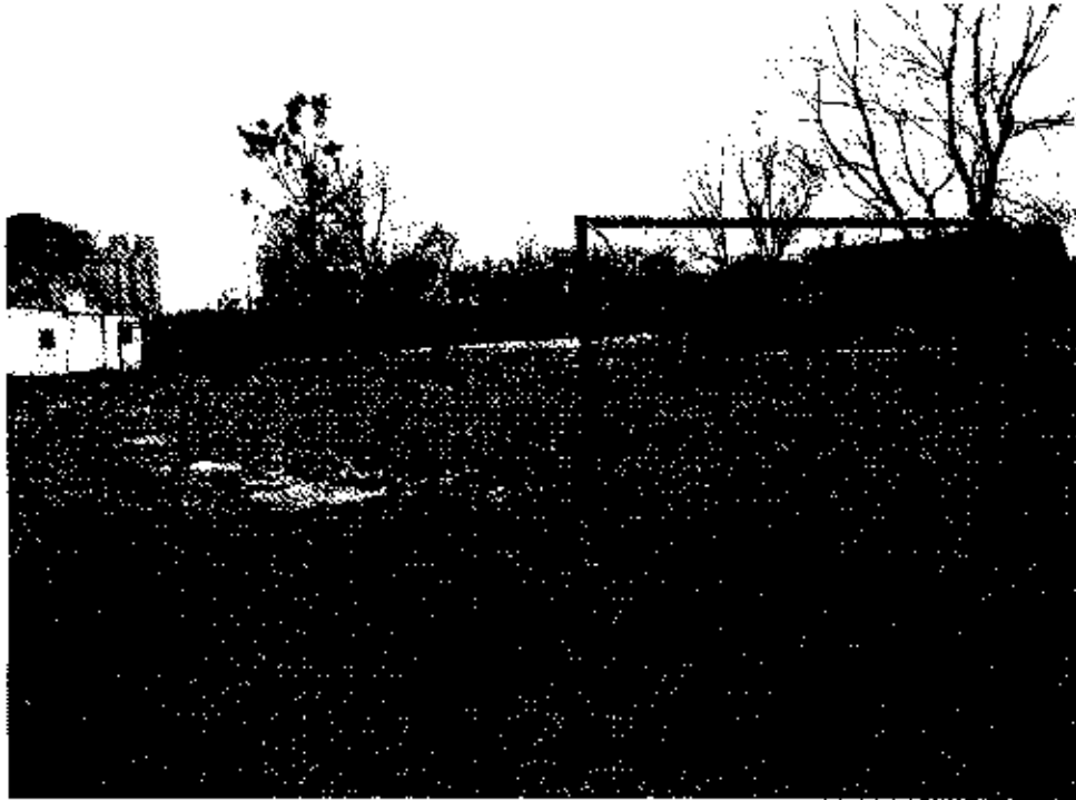
zdjęcie nr 6 *